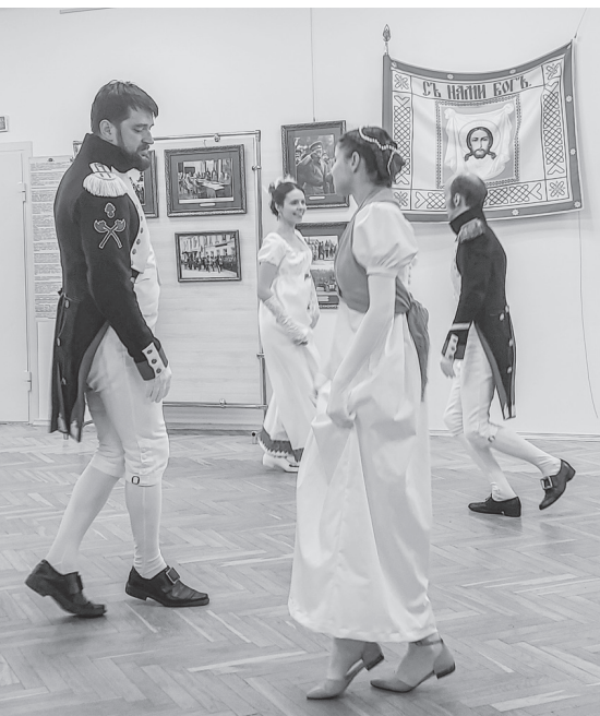
Фрагмент французскай кадрылі.